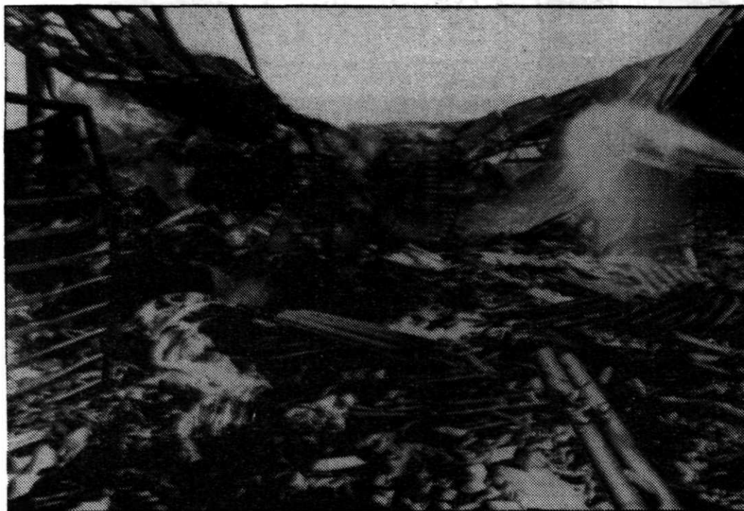
SALAMANCA.—Este es el estado de una parte de la fábrica de servilletas de papel que ha sido objeto de un incendio de grandes proporciones, en Salamanca. En la extinción del fuego ha habido ocho heridos entre bomberos y trabajadores de la misma. Esta fábrica está pasando por una fuerte crisis laboral.

SALAMANCA, 30. (Efe.)—Un incendio ha destruido una de las naves de la factoría salmantina de «Ureola Scott», dedicada a la fabricación de papel tissue. La factoría se encuentra en conflicto laboral desde hace un mes, como consecuencia de la decisión de la empresa de elevar un 4,5 por ciento el salario a los trabajadores. Recientemente la plantilla hizo huelga de 6 días y está prevista otra, indefinida, a partir de septiembre. Durante las operaciones resultaron heridas ocho personas, aunque no de gravedad,