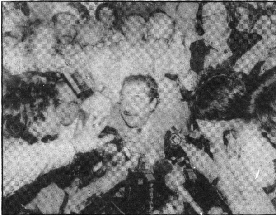
El presidente electo de Argentina, Raúl Alfonsín, contesta a las preguntas de los medios informativos al conocer su victoria en las elecciones para la presidencia de la República.

BUENOS AIRES, 31. (Efe).—Raúl Alfonsín obtuvo mayoría absoluta en la composición del colegio electoral, según informaciones obtenidas por «Efe» en fuentes oficiales del Gobierno argentino.