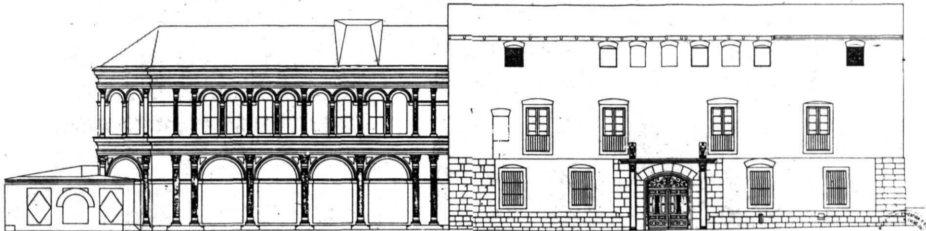
Plano de alzada de la Casa del Estudiante, del que es autora la arquitecto Cecilia Bielsa Príncipe.

Con un plazo de ejecución de doce meses y 183 millones de presupuesto