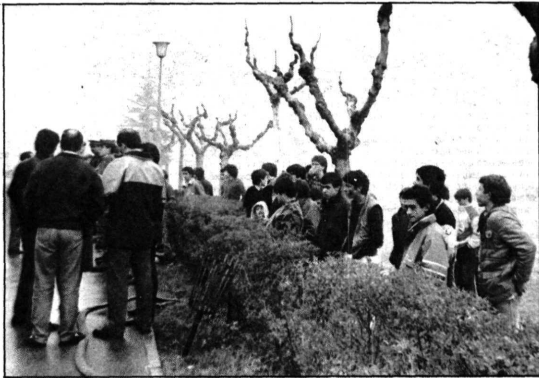
Los internos del centro han sido trasladados al «Juan de Austria».

Aunque en un principio los responsables pensaban que las llamas habrían destruido material del centro y habrían afectado