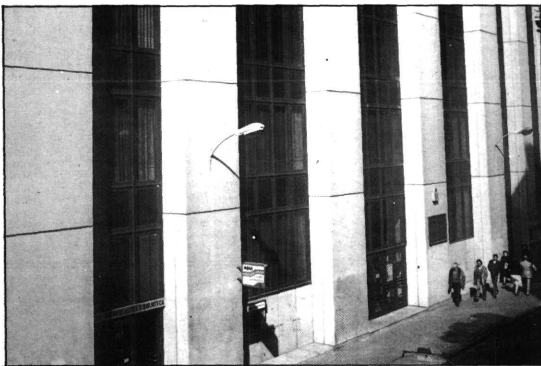
La Caja de Salamanca cuenta con oficinas, además de en la capital charra, en Valladolid, Zamora y Palencia. En la fotografía, la oficina provincial de Valladolid.

Al parecer, esta operación ha sido alentada incluso desde el propio Banco de España, que ha apoyado en todo momento el proceso de integración de entidades de ahorro en Castilla y León, con el fin de potenciar el poderío de las mismas y evitar riesgos financieros, cuyo ejemplo más conocido ha sido la desaparición de la Caja Rural de Palencia, en beneficio de las dos entidades más importantes del país, Cajamadrid y La Caixa, que ya han comenzado a abrir