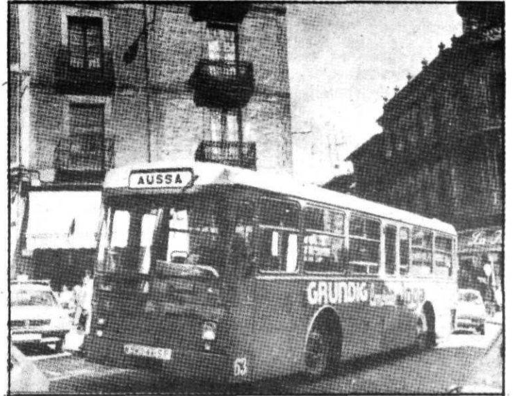
Para respiro de la ciudad desaparecieron los viejos autobuses.

El precio del billete de los autobuses no ha experimentado variación, ya que las tarifas correspondientes a este año todavía no han sido aprobadas por la Junta Regional de Precios. Por tanto el viaje seguirá costando 35 pesetas, aunque se ha establecido la modalidad del bono-bus para 10 viajes y con un precio de 250 pesetas; los pensionistas pueden disponer de talonarios