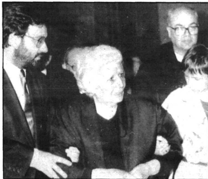
El ministro de Defensa, Narcís Serra, acompaña a la esposa y la nieta de Tarradellas.

la Generalitat, Jordi Pujol, ha permanecido durante toda la mañana en el Palacio y ha acompañado a la viuda de Tarradellas y a su hijo cuando éstos han vuelto a visitar la capilla ardiente. Las banderas del Palacio de la Generalitat y del Ayuntamiento ondeaban a media asta desde que se dio a conocer un decreto