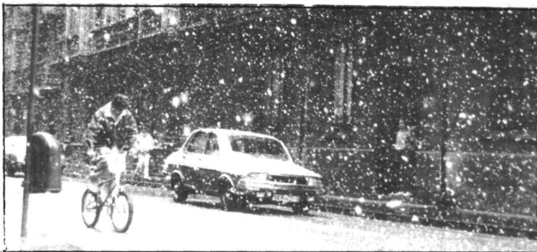
En numerosas zonas las nevadas fueron intensas.

En Burgos, la comarca de las Merindades, limítrofe con Cantabria y el País Vasco, es la más afectada por la nieve, con varias localidades incomunicadas temporalmente por la nieve.