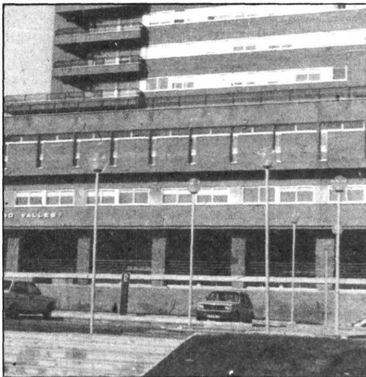
Los familiares han denunciado al INSALUD.

Este es uno de los hechos que ha suscitado mayor indignación en la opinión pública burgalesa ya que por diversos sucesos en las últimas semanas viene desconfiando de la sanidad en la capital y provincia.