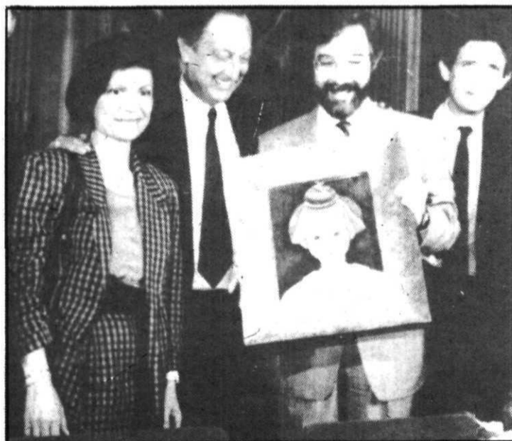
El gobernador civil de Barcelona entrega los cuadros a la Fundación Miró.

Los encuentros de Reagan y Gorbachov en Moscú, según el líder soviético han significado en inicio de la era del desarme. En apoyo de sus palabras y al entrar el miércoles en vigor el acuerdo para eliminar los misiles de alcance intermedio, ayer los soviéticos iniciaron la destrucción del armamento integrado en ese tratado. Los americanos han anunciado que iniciarán los trabajos de desmantelamiento el próximo otoño. Por otra parte, ayer finalizó la «cumbre de Moscú» con afectuosas palabras de los no hace mucho tiempo «enemigos históricos». En la foto superior, soldados soviéticos rodean de dinamita los misiles que posteriormente serán destruidos, foto inferior.