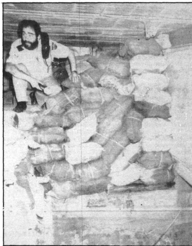
Interior del «zulo» donde se encontraron las diecisiete toneladas de hachís.

La Policía ha detenido a siete personas integrantes de una red internacional de narcotraficantes y ha incautado 17 toneladas de hachís, valoradas en más de 4.000 millones de pesetas, quince de las cuales fueron localizadas en un «zulo» situado en una cala de Lloret de Mar (Gerona).