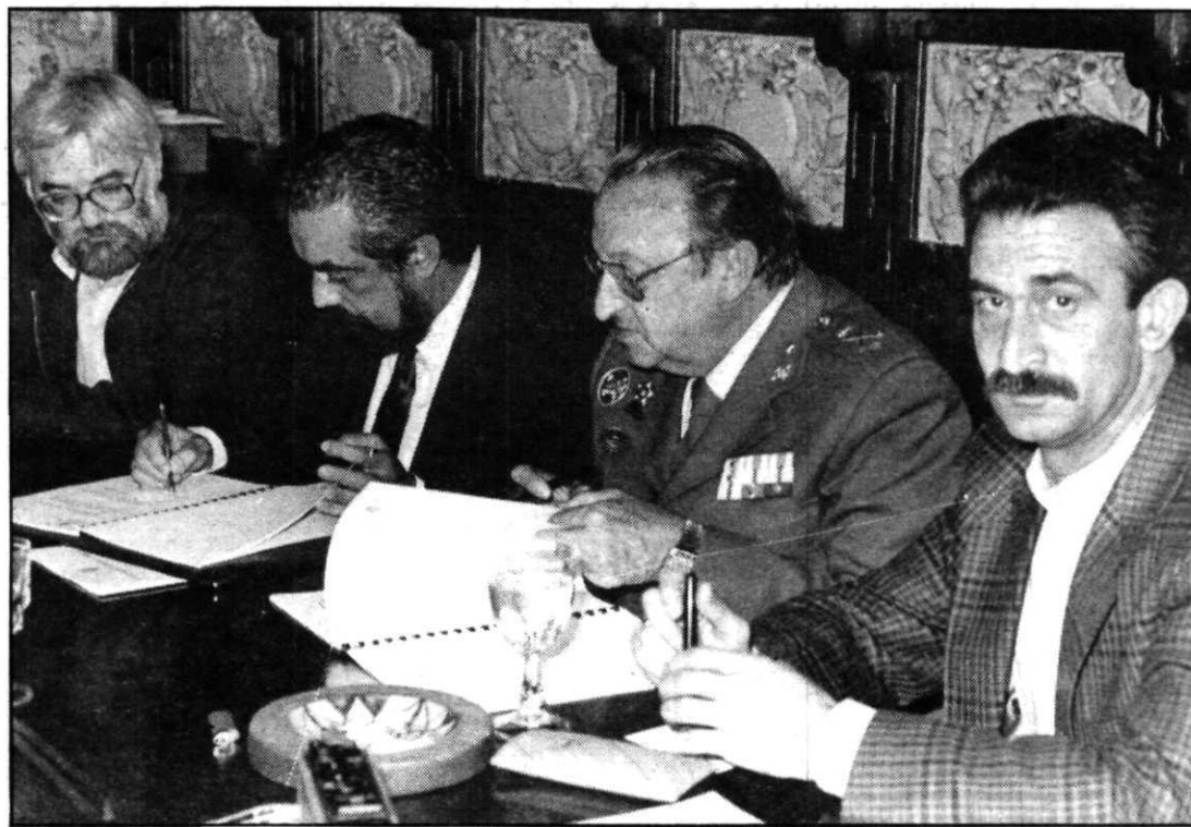
El general Valverde, el alcalde y los concejales de Hacienda y Urbanismo en el momento de la firma.

Este convenio, que ha sido precedido de largas negociaciones y cuyos términos fueron aprobados en Pleno el pasado mes de marzo, tiene como objeto la cesión por parte del Ministerio de Defensa de 28 hectáreas,