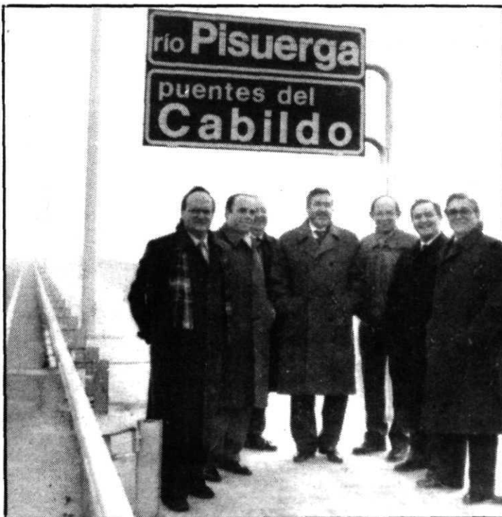
El delegado del Gobierno y técnicos del MOPU inauguraron ayer el nuevo tramo.

A pesar de lo corto del trazado abierto al tráfico, la complejidad del mismo hace especialmente importante su apertura. Un primer paso inferior bajo la N-620 a la altura de Tafisa da acceso a esta ronda, con varias salidas pocos metros después, entre ellas una al barrio de La Overuela. El paso inferior consta de dos vanos de 17,5 metros de luz y tableros de 12 metros de ancho. La segunda estructura importante, acaso la de mayor envergadura, son los llamados puentes del Cabildo, dos estructuras de voladizos sucesivos, que constan de tres vanos, dos de 45 metros de luz y uno central de 90 metros, con un ancho de tablero de 12 metros y aceras de 2,5