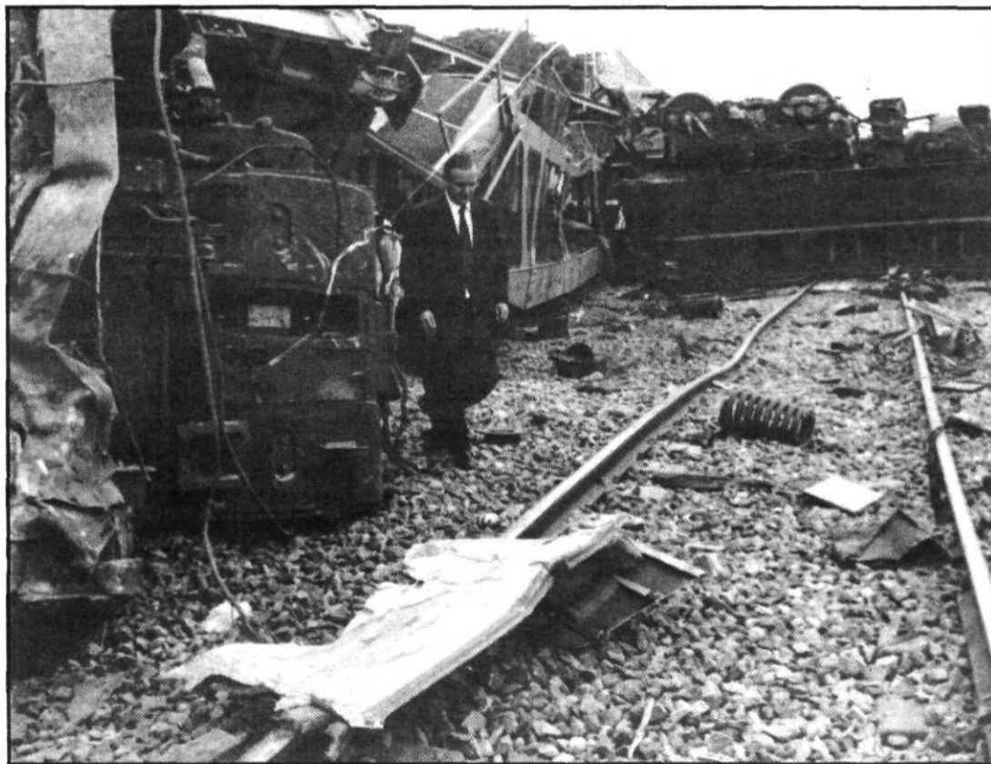
Todo era un amasijo de hierros en la estación de Arévalo tras la colisión.

Cinco personas han muerto y cuarenta y cuatro han resultado heridas como consecuencia del accidente ocurrido ayer en la estación de Renfe de Arévalo. La mortal colisión se produjo a las 11,53 de la mañana cuando el Talgo 131, procedente de Madrid con destino Gijón, se estrelló contra un tren de mercancías estacionado en la vía 3, que habitualmente no se utiliza para la circulación de vehículos. Dispositivos de la Guardia Civil, Cruz Roja de Avila y Segovia, junto con ambulancias de Arévalo y Medina del Campo, y bomberos de Madrid y Avila procedieron a una rápida evacuación de los heridos. Los viajeros del tren Talgo recibieron en todo momento ayuda, tanto por parte del Ayuntamiento de Arévalo, como por los vecinos de la localidad.