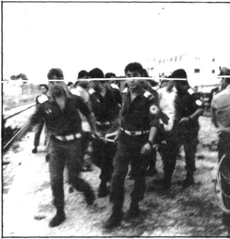
Los vagones, destrozados en gran parte, quedaron atravesados en la vía. A la derecha, los primeros momentos del rescate de las víctimas. (FOTOS)

El Talgo entró en la estación por una vía que no era la suya