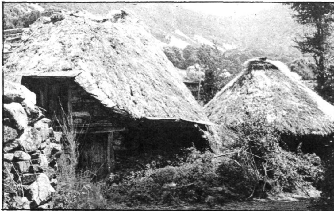
Pallozas de Burbia, en Los Ancares, antes del incendio.

Las pallozas constituyeron, hasta bien entrado el presente siglo, la vivienda tipo y única de