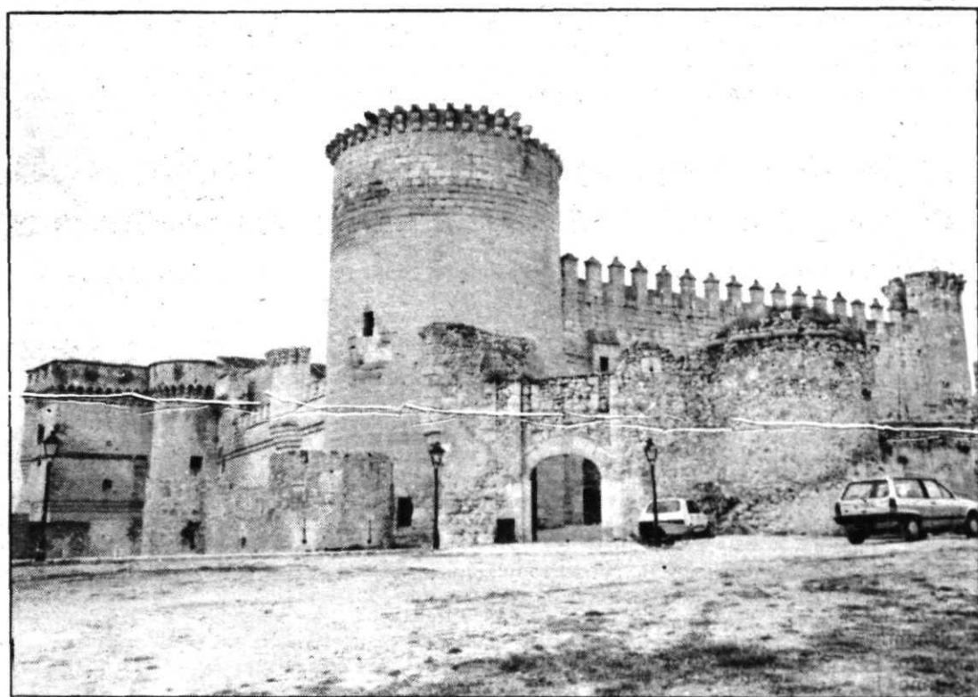
Vista del castillo de Cuéllar.

proyecto, la Corporación Municipal presentó a la comisión senatorial un borrador del proyecto de recuperación de la fachada norte del castillo y de las balaustradas del patio de armas, así como un estudio de recuperación de las ruinas de la iglesia de San Francisco, que se basaría fundamentalmente en la conservación de sus capiteles y la recomposición de las paredes de todo el conjunto. Este último trabajo entra dentro del proyecto de rehabilitación del Parque de San Francisco y es uno de los proyectos más ambiciosos de la actual Corporación Municipal. El presupuesto total del mismo, obra del arquitecto segoviano Alberto García Gil, alcanzaba la cifra de los 100 millones de pesetas, y dentro del plan de recuperación del parque figura la idea de construir un monumento dedicado a los tres cuellaranos que tuvieron una importancia decisiva en el descubrimiento de América: Diego Velázquez, Juan de Grijalva y Gabriel de Rojas. En concreto, la idea del polémico arquitecto segoviano se basa en la construcción de tres columnas que honren la memoria de estos tres ilustres cuellaranos de cara a la celebración del V Centenario. Este proyecto se encuentra en la actualidad parado por falta de asignación presupuestaria por parte de la Administración autonómica.