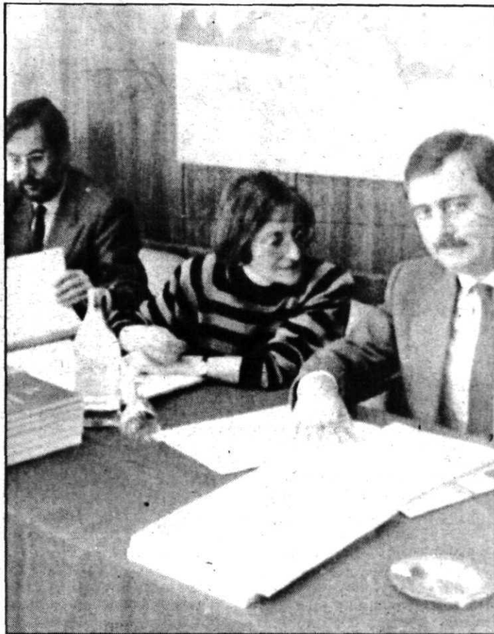
Javier Solana con representantes de Educación.

En este mismo marco se han estudiado los aspectos referentes al profesorado. El personal docente de las nuevas Universidades públicas y privadas no podrá