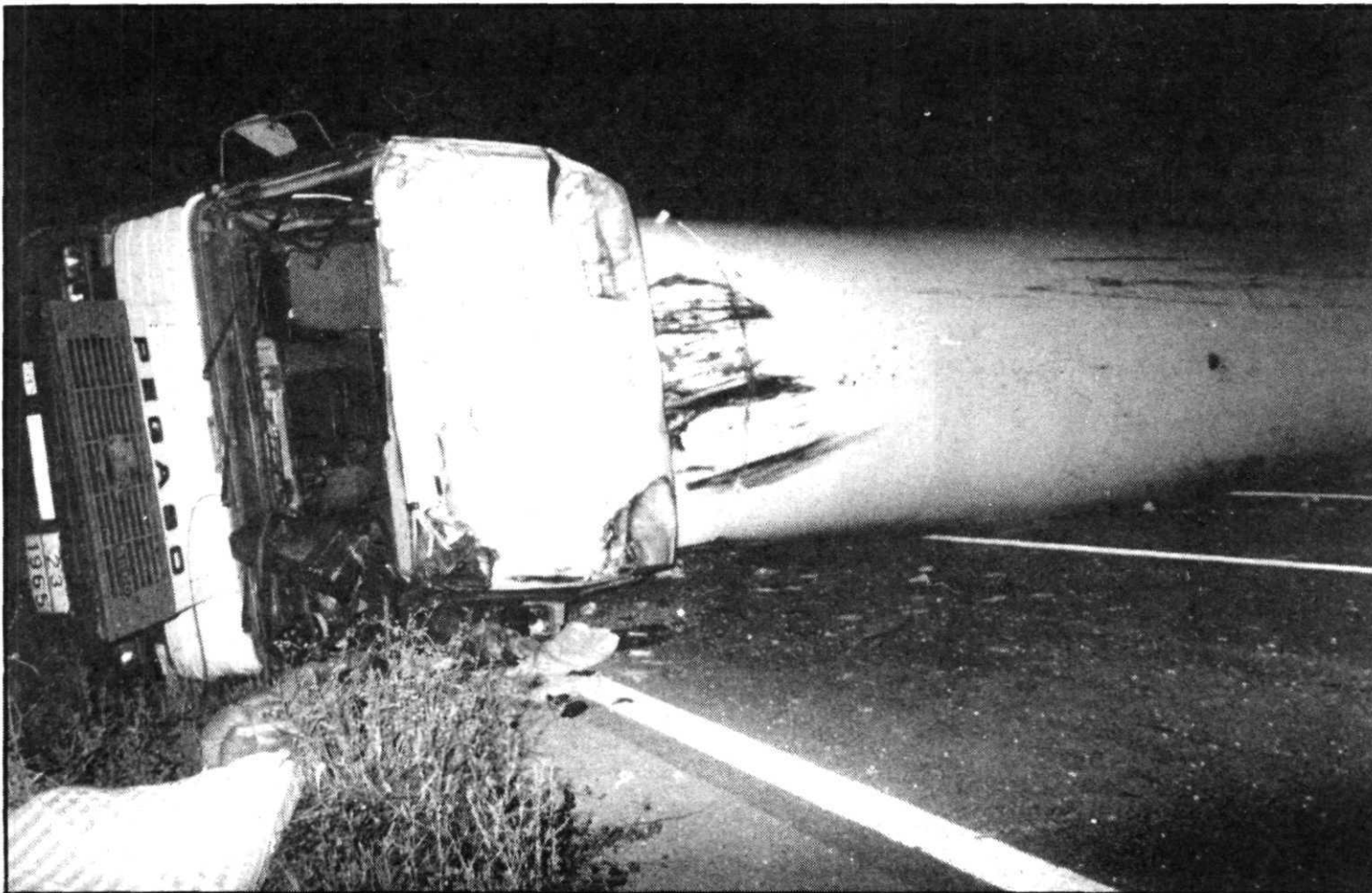
El camión cisterna de Repsol estuvo volcado varias horas en la Carretera Nacional II, a su paso por Arcos de Jalón, tras el accidente.

PALENCIA C/. Cardenal Almaraz, 4 (junto Seminario). Teléfs. (988) 750571-72 ZAMORA C/. La Brasa, 8, 1.º. Edificio «El Mercadillo». Teléf. (988) 530626 SEGOVIA Calle Conde de Gazola, 2. Teléfs. (911) 428812 y 428895. SALAMANCA Músico Antonio Baclero, 2, 3.º K. AVILA Vallespín, 44, 1.º. Teléf. (918) 213025. SORIA C/. Clemente Sáenz, 1 - 2.º A. Teléf. (975) 228287. BURGOS C/. Reyes Católicos, 25, 4.º. Teléf. (947) 229856. LEON Ausente, 2, 3.º D. Teléf. (987) 241481. MEDINA DEL CAMPO Plaza Mayor, 41. Teléf. 803401