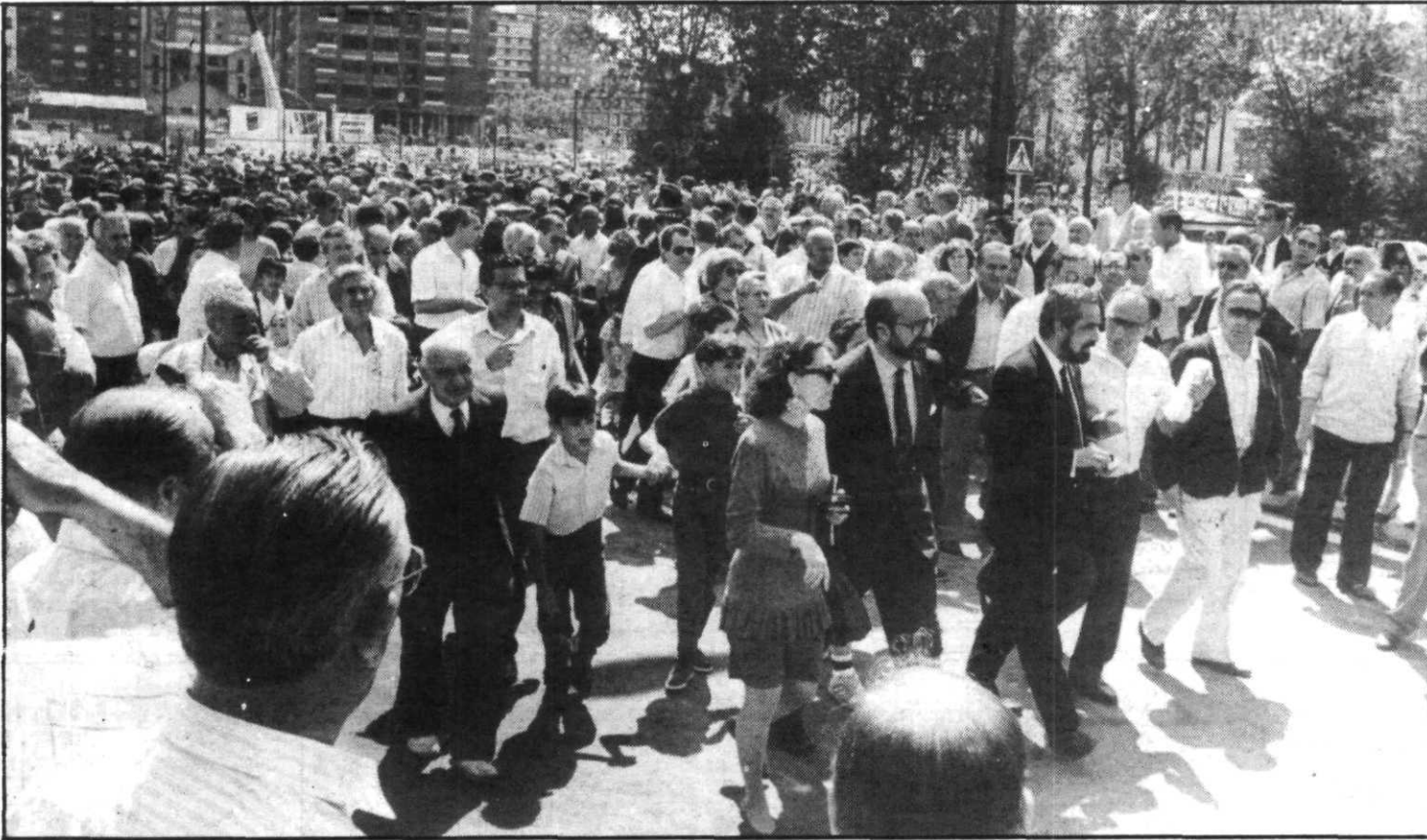
Miles de personas se dieron cita en la inauguración del nuevo puente.