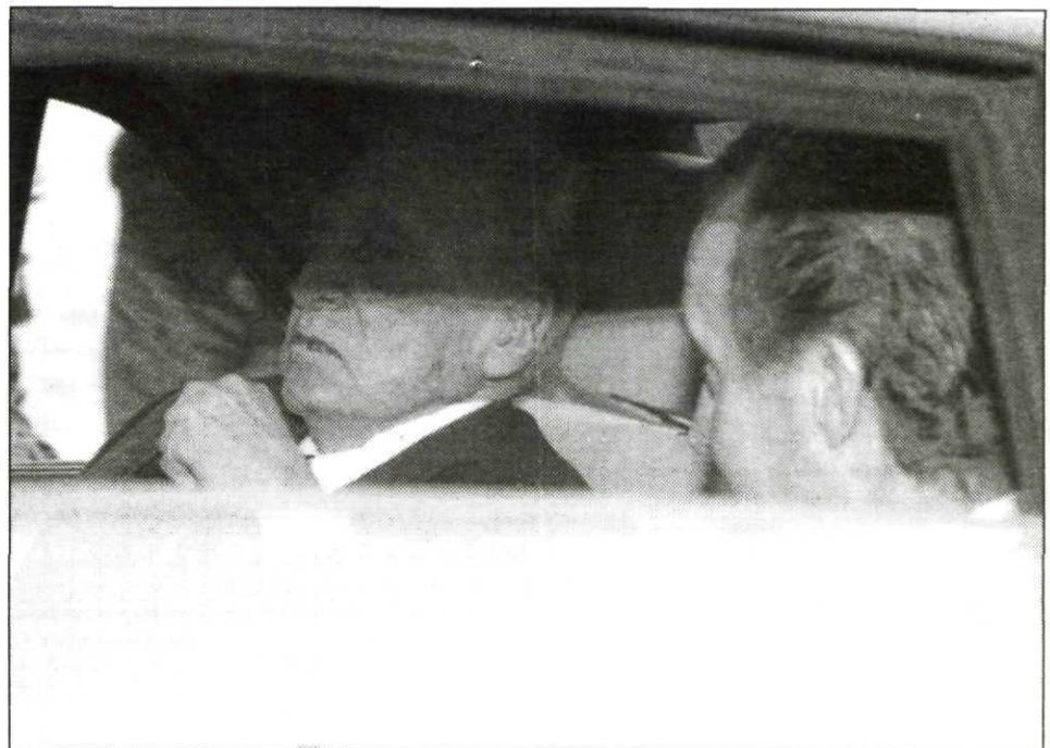
Don Alfonso falleció en 1956. A la derecha, el Rey Juan Carlos y su padre a la llegada a El Escorial.