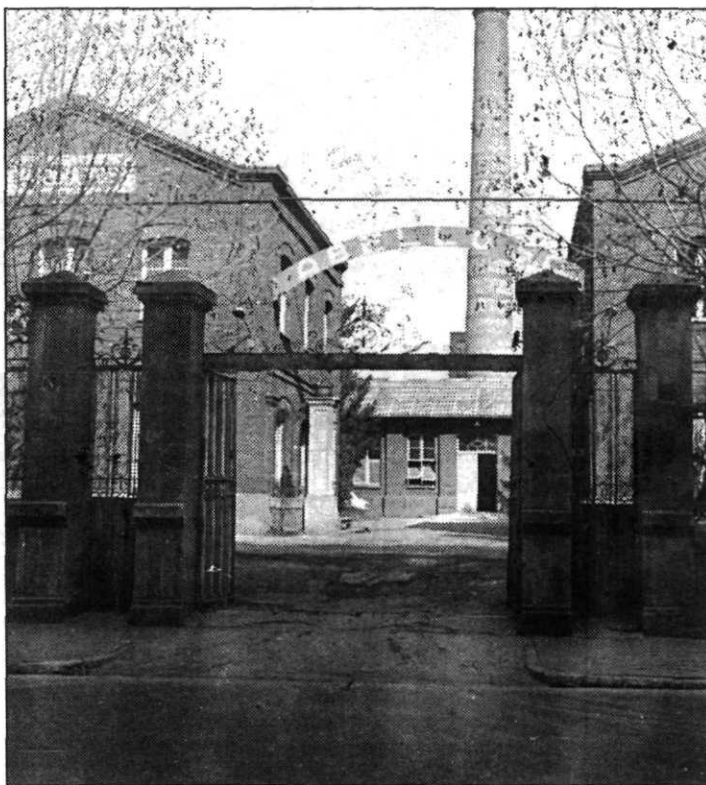
Instalaciones de la fábrica de Antibióticos Abelló.