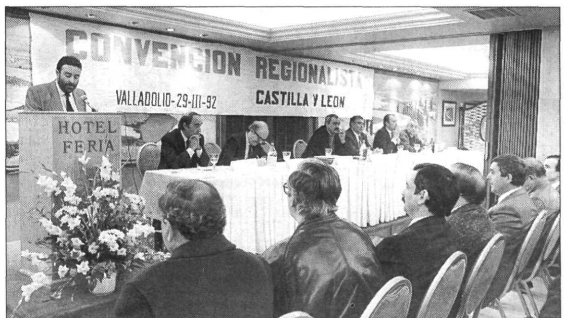
Un momento de la convención regionalista ayer en Valladolid.