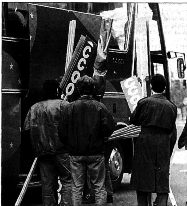
Trabajadores palentinos parten hacia Guardo.

En Segovia y Avila, los trabajadores de la resina se encerraron tras la manifestación en las delegaciones territoriales de la Junta de Castilla y León en protesta por el abandono del sector por parte del Gobierno regional. Los resineros, que también se encerraron en So-