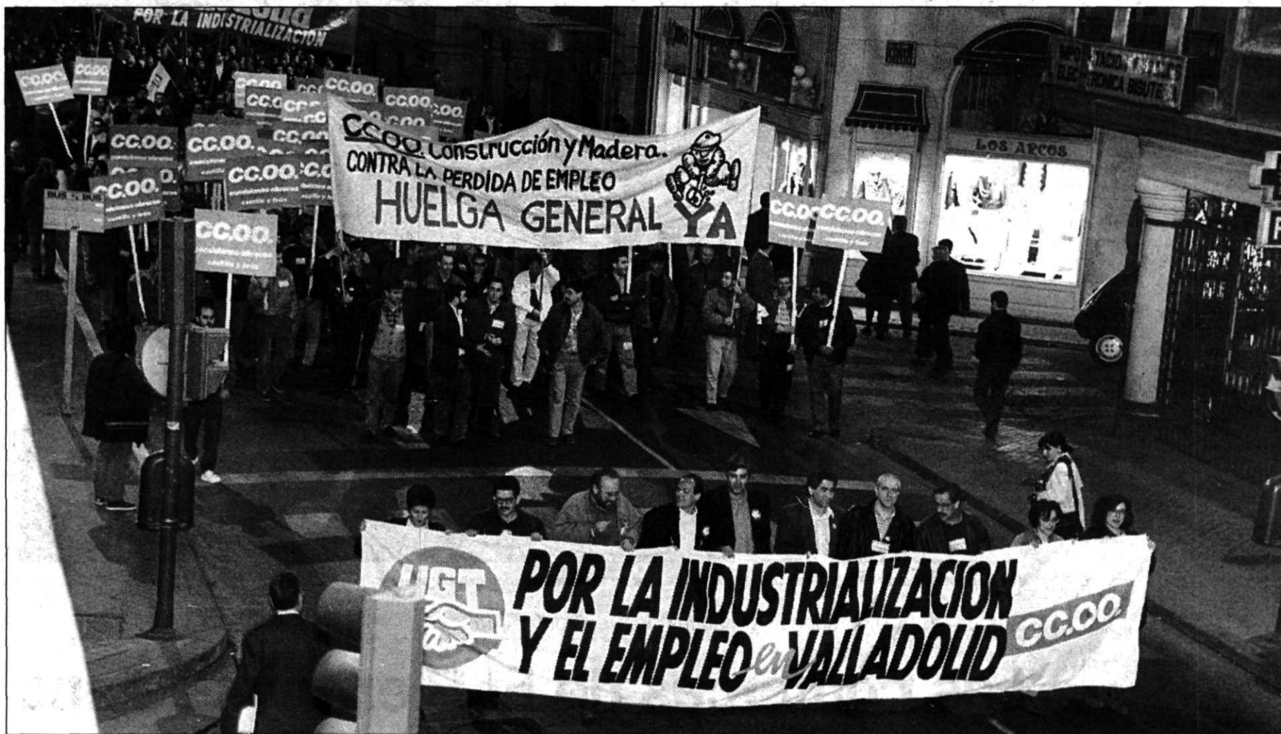
Las manifestaciones se repitieron en todas las provincias de la región salvo en Soria. En la instantánea, un momento de la de Valladolid.

Las manifestaciones convocadas por los sindicatos en la región fueron secundadas de forma masiva