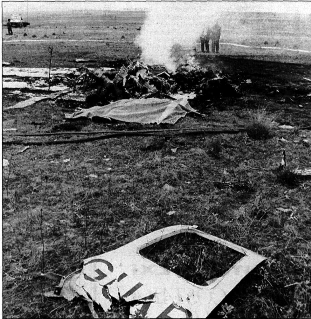
Estado en que quedó el helicóptero tras chocar contra el suelo y explotar.