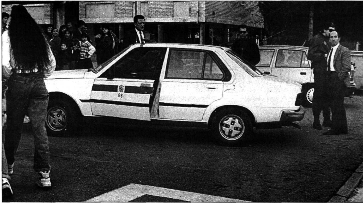
El taxista leonés, en la parte izquierda, explica lo sucedido a un policía. El vehículo, al parecer, se quedó sin gasolina.

No se descarta una posible vinculación con un comando etarra