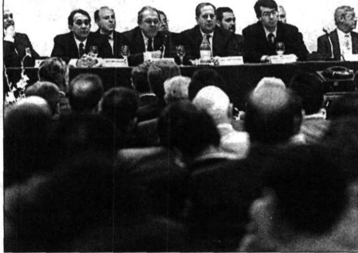
Aspecto de la mesa del Congreso de Minas.