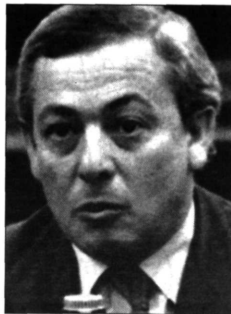
Carlos Solchaga, ministro de Economía.

Sobre la acusación de la Junta al PSOE de no ayudarla en sus reivindicaciones frente al Gobierno central, el jefe de la oposición regional dijo que echa de menos que el presidente de la Comunidad, Juan José Lucas, le pida su colaboración en temas de interés para la región.