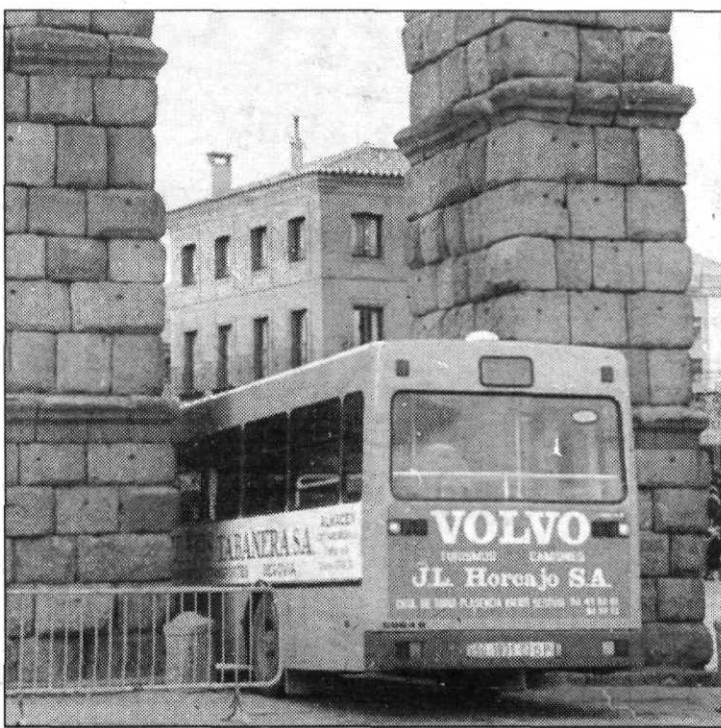
El corte del tráfico bajo el acueducto será total.

Aunque la principal causa de esta remodelación se debe a la alarma suscitada sobre el estado de conservación del Acueducto y al corte bajo su estructura registrado el pasado verano, esta reforma era una de las más necesarias de la ciudad desde hace años según la opinión más generalizada.