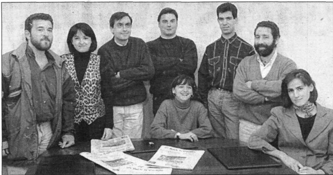
La Redacción de Segovia hizo un alto en el trabajo para posar.

La Edición de Segovia de EL NORTE DE CASTILLA constituye toda una novedad editorial en esta provincia, al ser el primer periódico de su historia que saldrá todos los días de la semana.