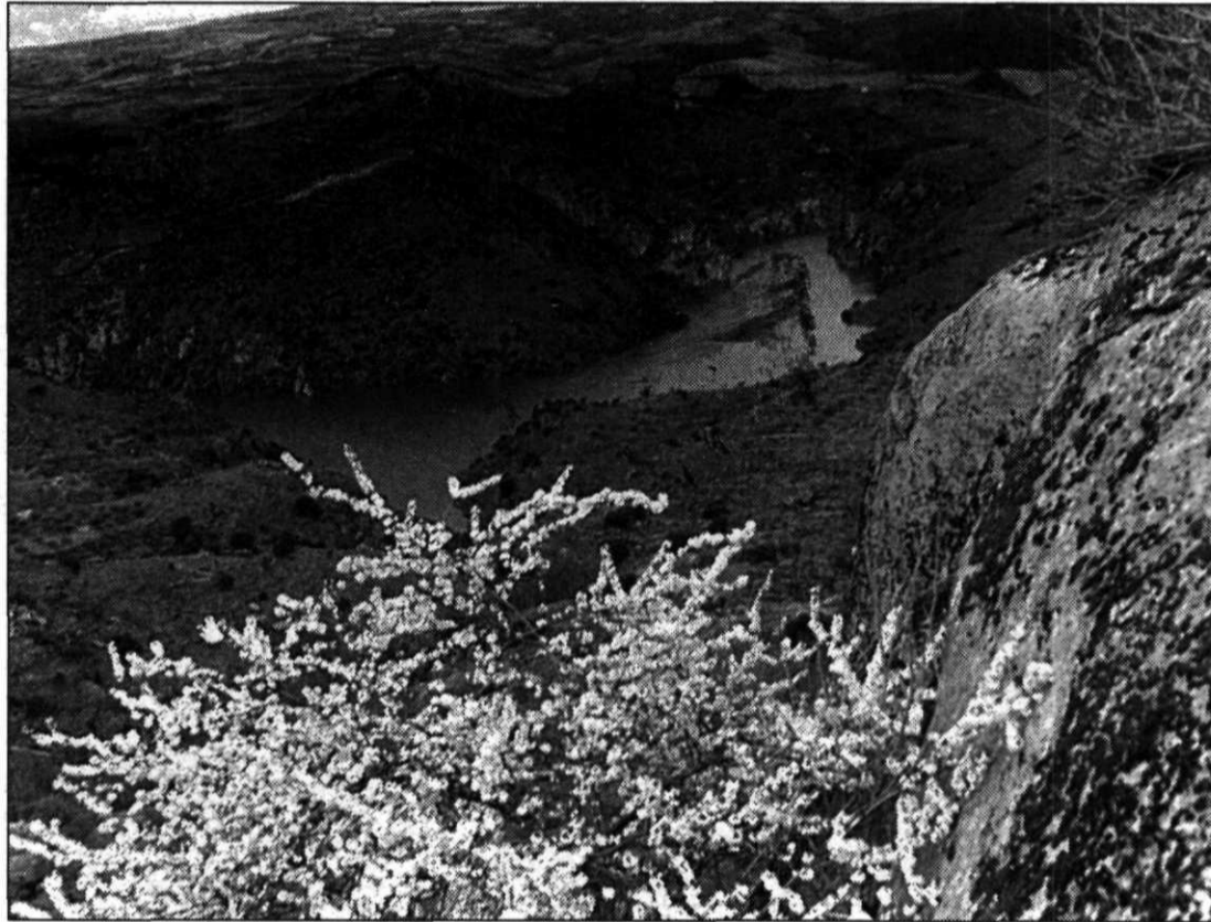
Las investigaciones geofísicas se extenderán a los Arribes del Duero.

La empresa Adara, S.A. remitió un escrito a los 30 municipios de la comarca zamorana, en el que les comunica que la empresa está realizando trabajos de investigación geológica