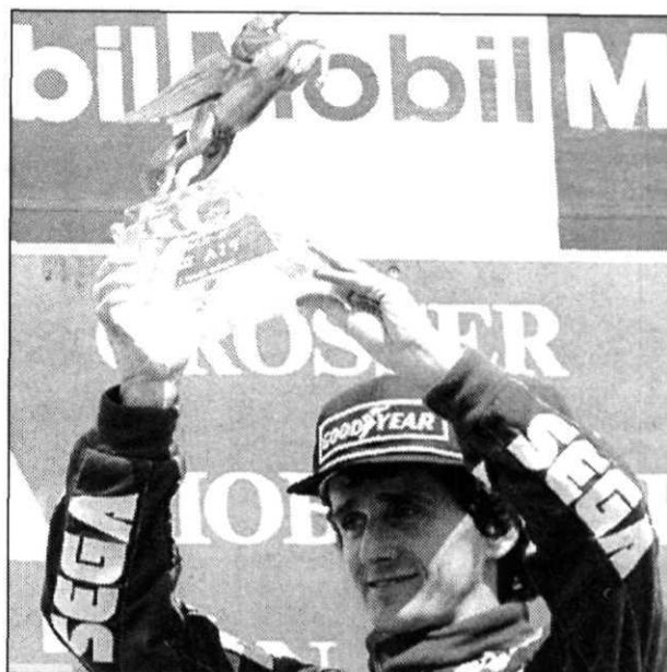
Prost sumó su 51 victoria en el Gran Premio de Alemania