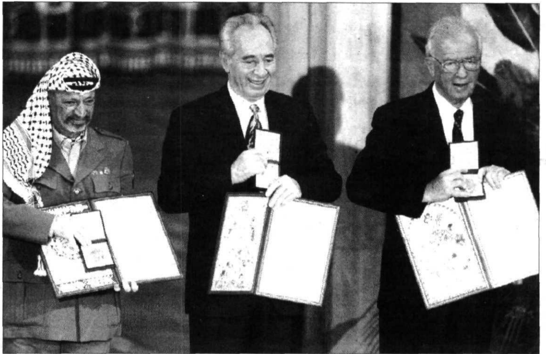
De izquierda a derecha, Arafat, Peres y Rabin muestran sus respectivos Nobel.

«Quiero rendir homenaje a cada uno de ellos, pues este pre-