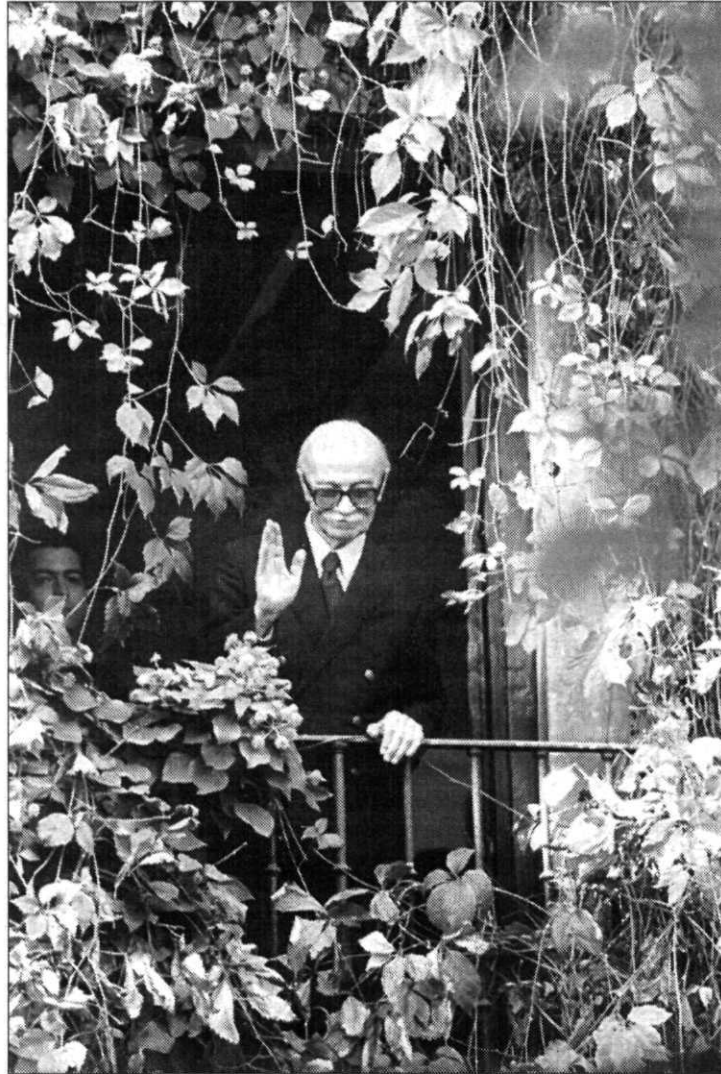
El «Cervantes» Ernesto Sábato desde el balcón de la Casa de Cervantes, y lectura y firma del Documento de Valladolid.

Hablaron, antes o después de firmar, Sábato, quien auguró a los «prepotentes y racistas nor-