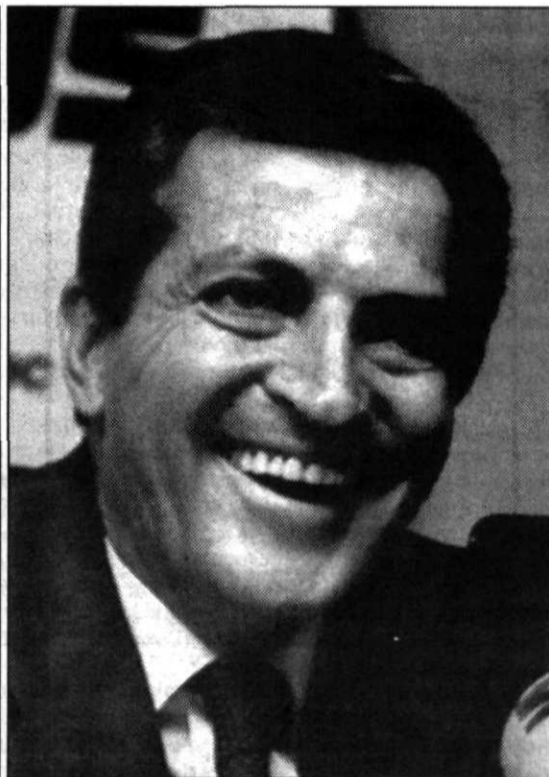
El presidente de la Junta, Juan José Lucas, y el ex presidente del Gobierno, Adolfo Suárez.

mos. Esta figura institucional disfrutará de autonomía e independencia y no recibirá instrucciones de ninguna autoridad a la hora de investigar y resolver las quejas que formulen los ciudadanos.