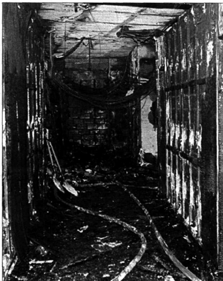
Interior del edificio tras el incendio.

Según los bomberos, en las últimas semanas se han producido otros dos hechos de caracte-