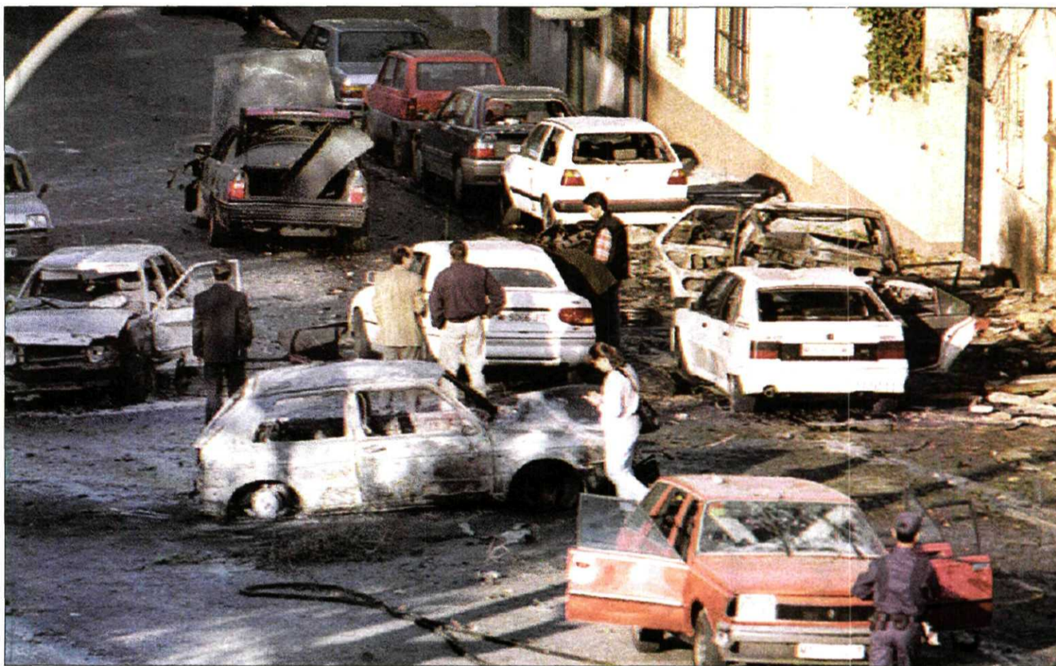
Lugar del atentado con el vehículo de Aznar (al fondo, de color negro) y el coche-bomba (a la derecha junto a un coche blanco).