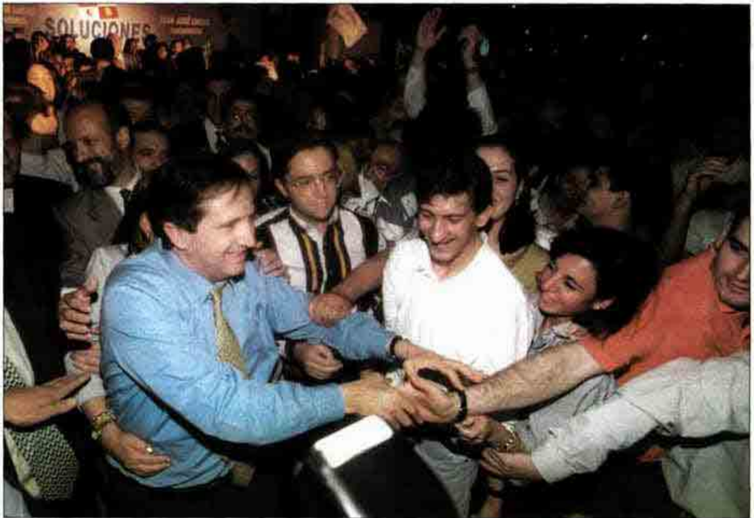
Juan José Lucas celebra el triunfo con afiliados y simpatizantes en la Feria de Muestras de Valladolid.

El presidente electo de Castilla y León, Juan José Lucas, manifestó tras conocer la victoria que se abre una nueva época con una mayoría más firme y estable para el Partido Popular. Al tiempo que Lucas lanzaba una oferta de diálogo y entendimiento con el resto de las fuerzas parlamentarias, el líder conservador, José María Aznar, anunciaba que comenzaba la campaña electoral para las generales.