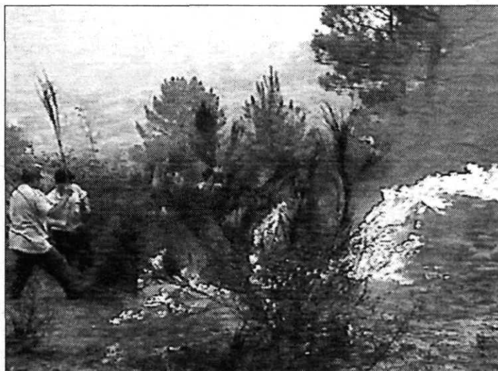
Incendio cercano al municipio abulense de El Tiemblo.

En la reunión de Madrid, los responsables de las fiscalías, de los cuerpos y fuerzas de seguridad del Estado y de los gobiernos autonómicos acordaron fomentar la especialización en técnicas de investigación de los incendios y elaborar un inventario de las causas y motivaciones de los siniestros forestales producidos por el fuego para ampliar