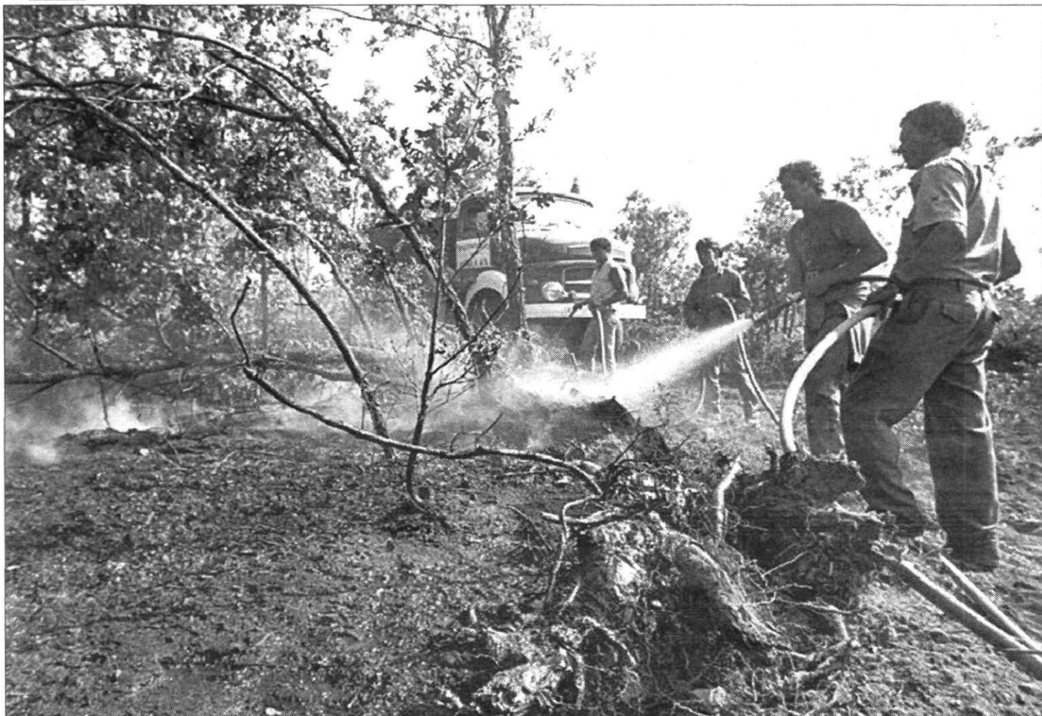
Un grupo de voluntarios intenta sofocar uno de los incendios producidos el pasado sábado en la provincia de Salamanca.

Un rayo provocó once fuegos durante la noche del lunes en Salamanca