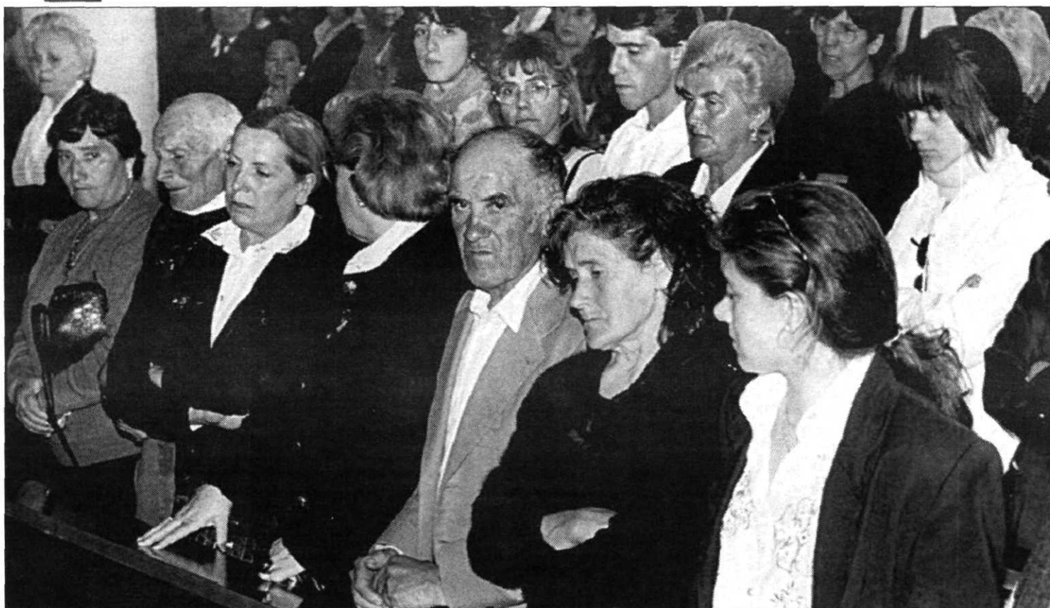
Familiares de las víctimas durante el funeral celebrado ayer en el tanatorio de León.