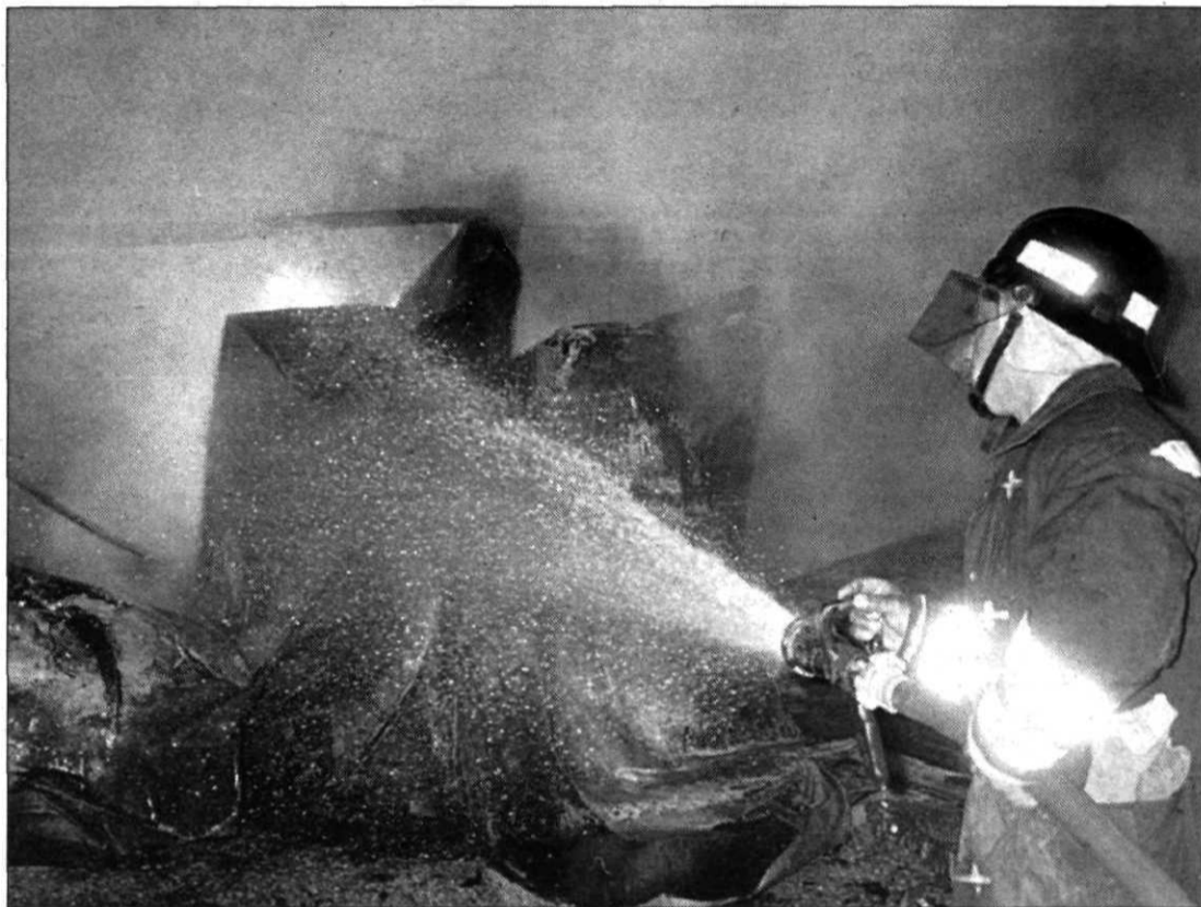
Un bombero aplica agua sobre los últimos rescoldos del incendio.

En la extinción del incendio, del que en estos momentos aún queda un pequeño foco por sofocar, según comentaron fuentes policiales, han participado los 26 bomberos y los 6 vehículos que componen el Parque de Soria, 2 camiones cisterna de la Diputación, y otros dos de empresas privadas, además de numerosos efectivos de la Policía Local y