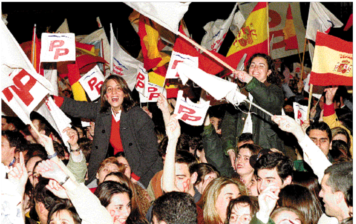
Miles de simpatizantes del Partido Popular festejan el triunfo de Aznar.

Cuadernillo central Editorial en página 17