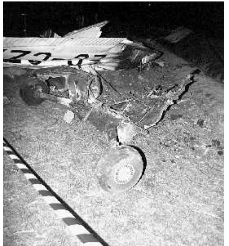
Restos del aparato siniestrado en Villanueva de Gómez.