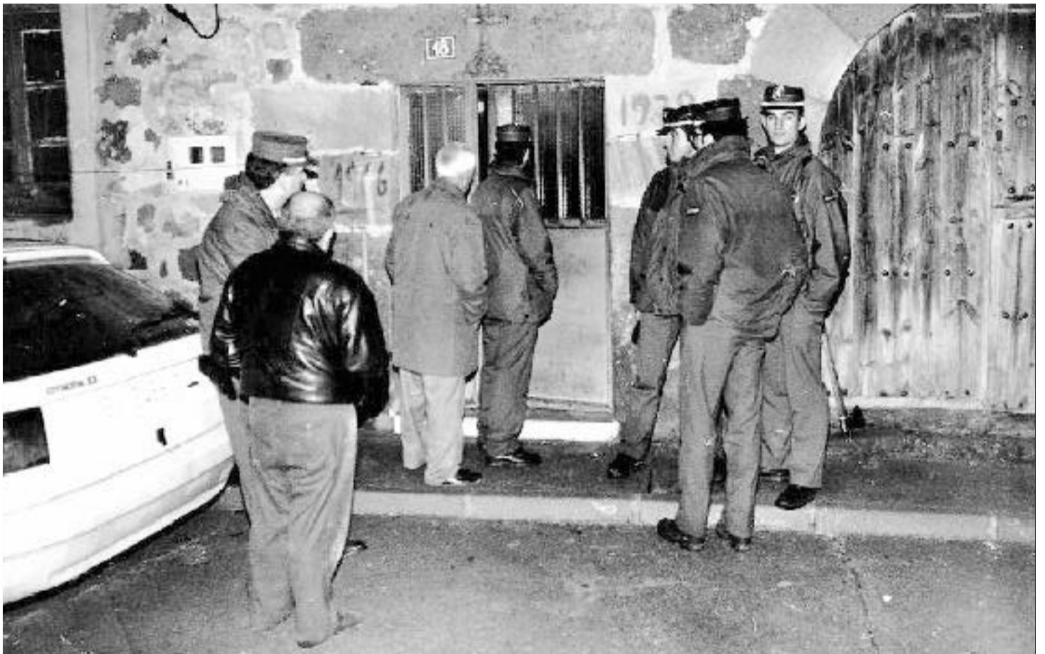
Efectivos de la Guardia Civil, en la puerta de la casa de San Millán de Lara donde se produjo la segunda matanza.