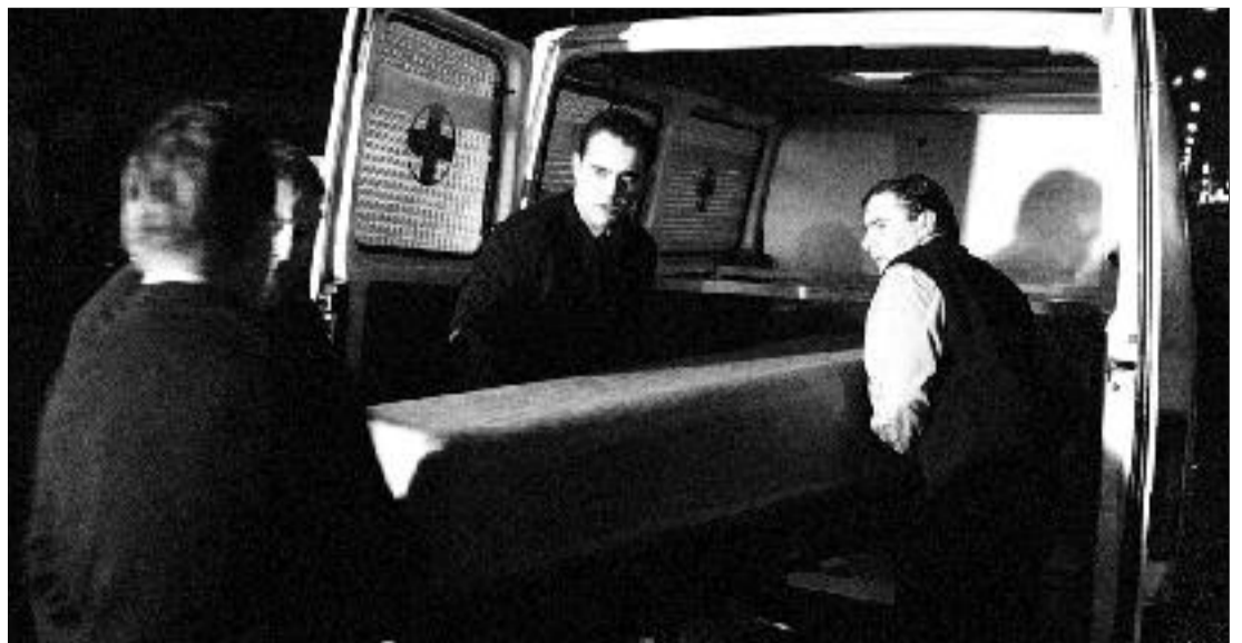
El féretro con uno de los cadáveres de Burgos es introducido en la ambulancia.