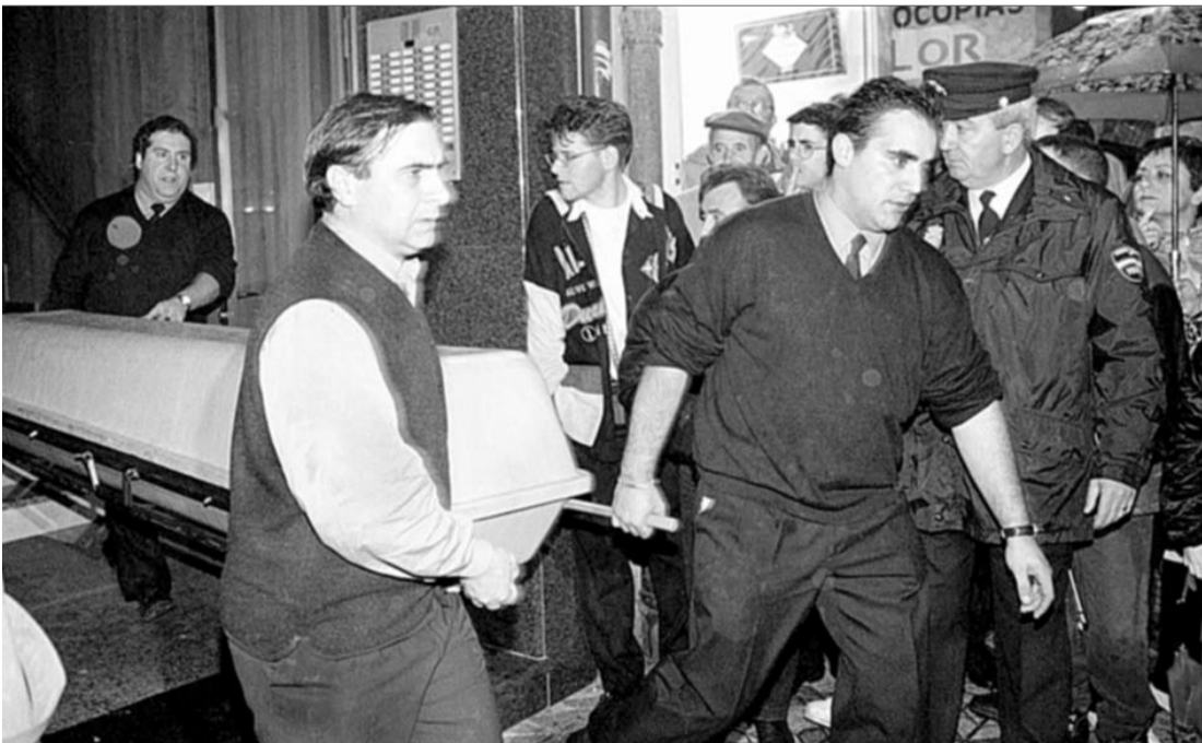
Empleados de la funeraria sacan uno de los cuerpos de la vivienda de Gamonal.