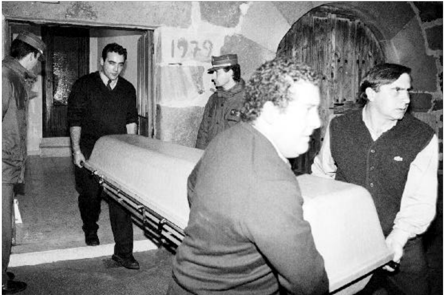
Miembros de la funeraria sacan uno de los ataúdes con una de las víctimas de la matanza.

Sin embargo, afirma que era un hombre muy autoritario y que en alguna ocasión ya se había dirigido a los jóvenes de la localidad con amenazas cuando demostraban interés por hablar con María del Carmen y Rosa, las jóvenes de 22 y 15 años, a las que asesinó en su domicilio de Burgos.