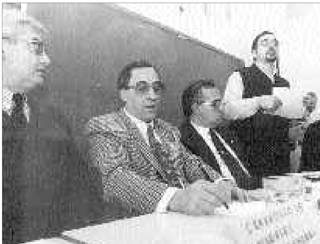
Unos 80 miembros de las 17 asociaciones asistieron a la constitución de la plataforma.

Las 17 asociaciones de la plataforma acordaron igualmente darse de baja de la Confederación Española de Asociaciones de Padres de Alumnos (Ceapa), por considerar que no se sienten representados por ella, al conocer que su dirección se ha opuesto a las reivindicaciones de estos padres.