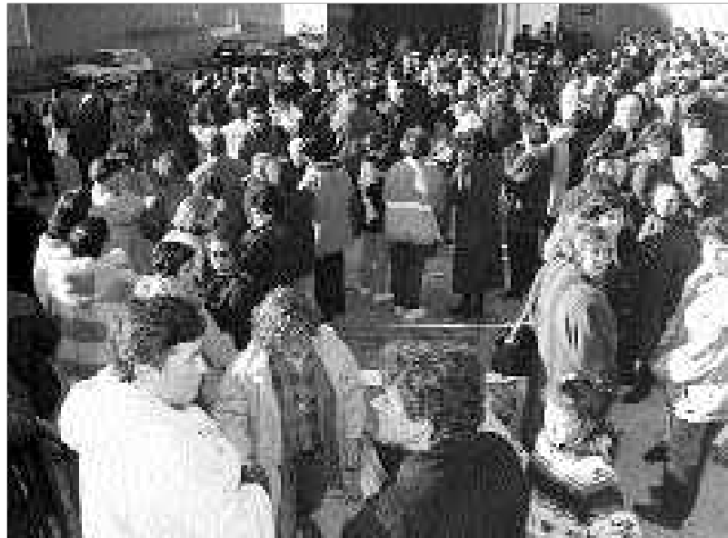
A la izquierda, padres, escolares y vecinos de toda la comarca concentrados a la puerta del colegio de Mayorga el pasado miércoles. Debajo, detalle de una pancarta reivindicativa en el vallado del mismo centro escolar.

En vista de que la postura de la Dirección Provincial es firme y la guerra será larga, los niños de Mayorga volverán mañana al colegio y serán los padres los que se encierren, al igual que en otras localidades, todos los miércoles en los colegios. Si los de Mayorga han protagonizado