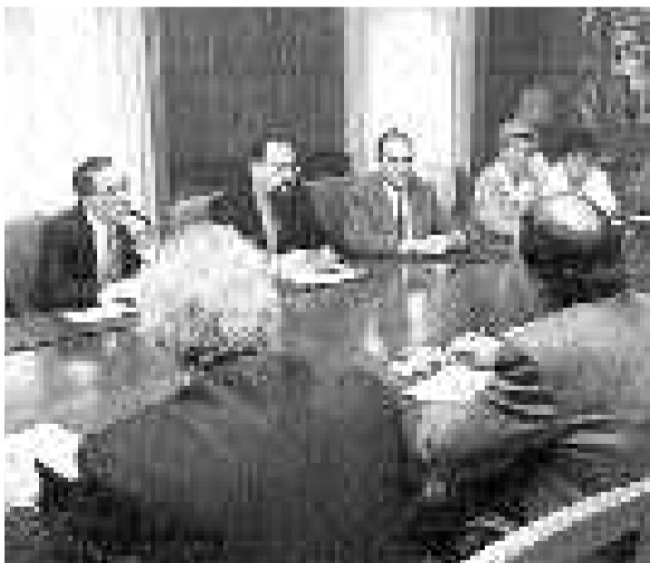
Reunión de la APA de Fermoselle con el gobernador.

Los criterios que la plataforma propone para modificar esta red o mapa escolar son el mantenimiento de la ESO en los actuales centros de EGB, potenciando y revisando la estructura de los Centros Rurales Agrupados (CRAs) allí donde sea necesario, y la negociación, con criterios específicos para el medio rural, para el mantenimiento y construcción de centros de Secundaria allí donde se den las condiciones.