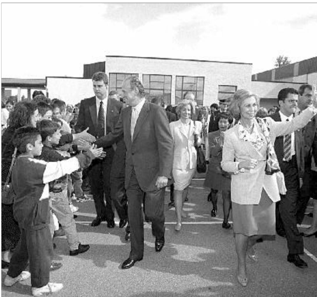
Los Reyes saludan a los escolares de La Palomera, tras la visita al colegio.

Los Reyes presidieron ayer, en la capital leonesa, los actos oficiales de la apertura del curso escolar en todo el país. Acompañados por la ministra de Educación y Cultura, Esperanza Aguirre, del presidente de la