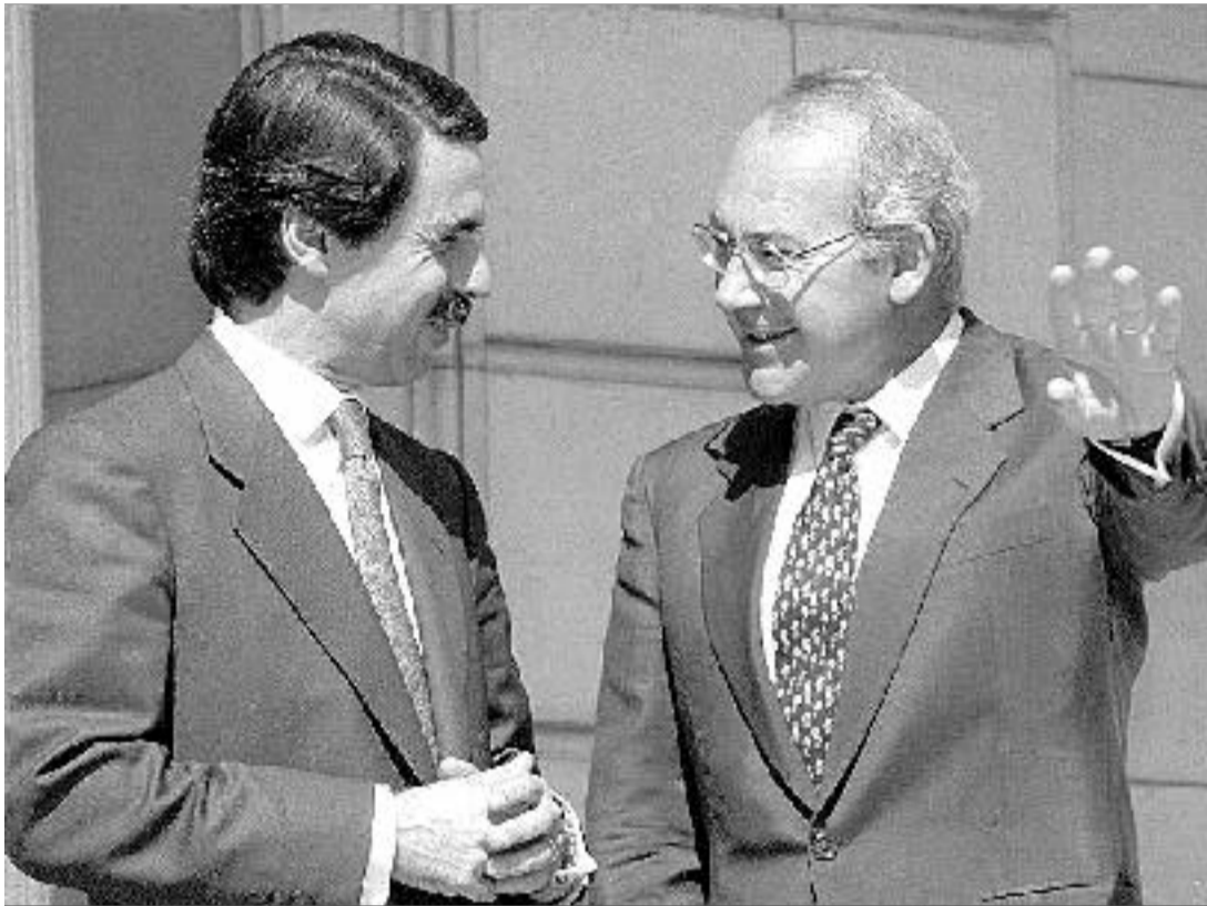
Aznar y Ardanza poco antes de iniciar su entrevista en el la Moncloa.

Asimismo, la cesión de la capacidad normativa sobre el IRPF para equipararla con la que tiene Navarra encuentra dificultades en las negociaciones con el Ministerio de Economía que esperan solventarse con la