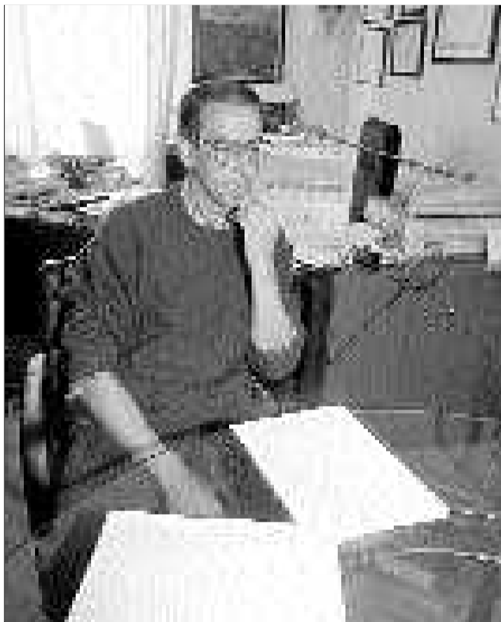
Urbón, ayer, en el momento de conocer la sentencia.

y disgustado tras conocer el contenido de su sentencia de separación. Para él, el dinero no es importante y aseguró que estaría dispuesto a renunciar a