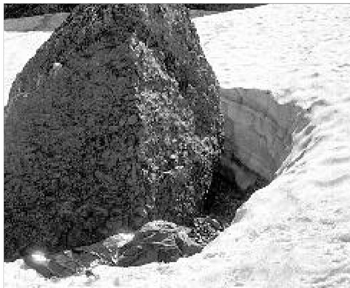
Cadáver de uno de los dos montañeros, junto a una roca.

Los cadáveres de ambos jóvenes presentaban muestras de descomposición, aunque su estado, según la información