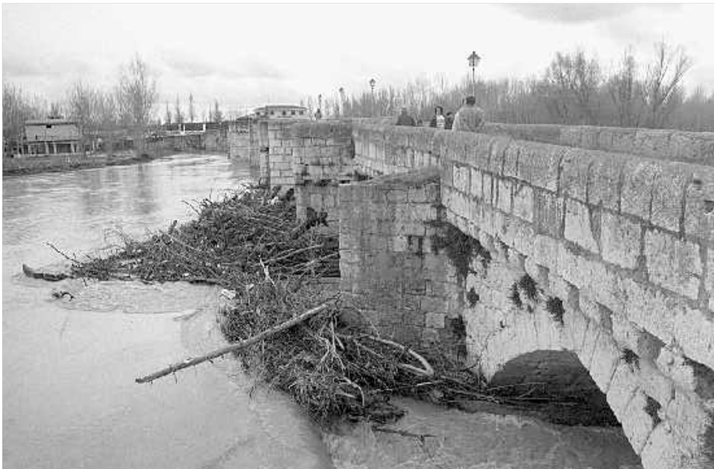
Los troncos atoraban ayer los ojos del puente romano de Simancas, cerrado al tráfico.