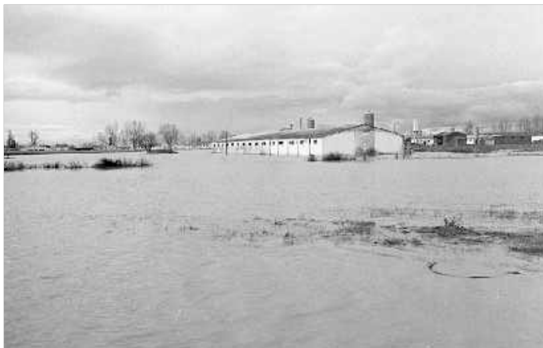
Las aguas del Cea rodean una nave de cerdos en el municipio de Mayorga.

Aparte de las avenidas de agua del Sequillo y el Valderaduey, el último río de la provincia por el norte, el Cea, también se ha desbordado en varios puntos de su cauce. En Mayorga, el Cea ha llegado hasta varias naves ganaderas, ha inundado la vega y se ha llevado por delante