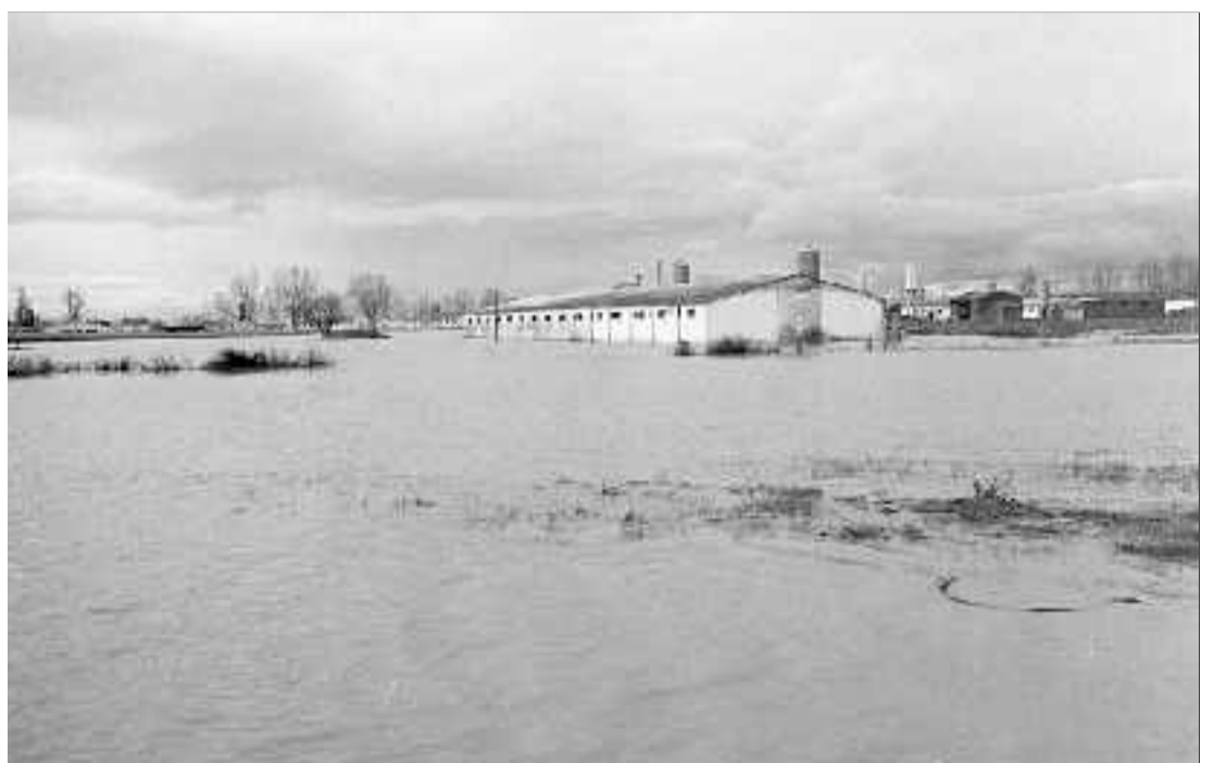
Las aguas del Cea rodean una nave de cerdos en el municipio de Mayorga.

El puente romano de Simancas hubo de cerrarse ayer al tráfico por peligro de desprendimientos. Una excavadora trabajó para limpiar de maleza los ojos.