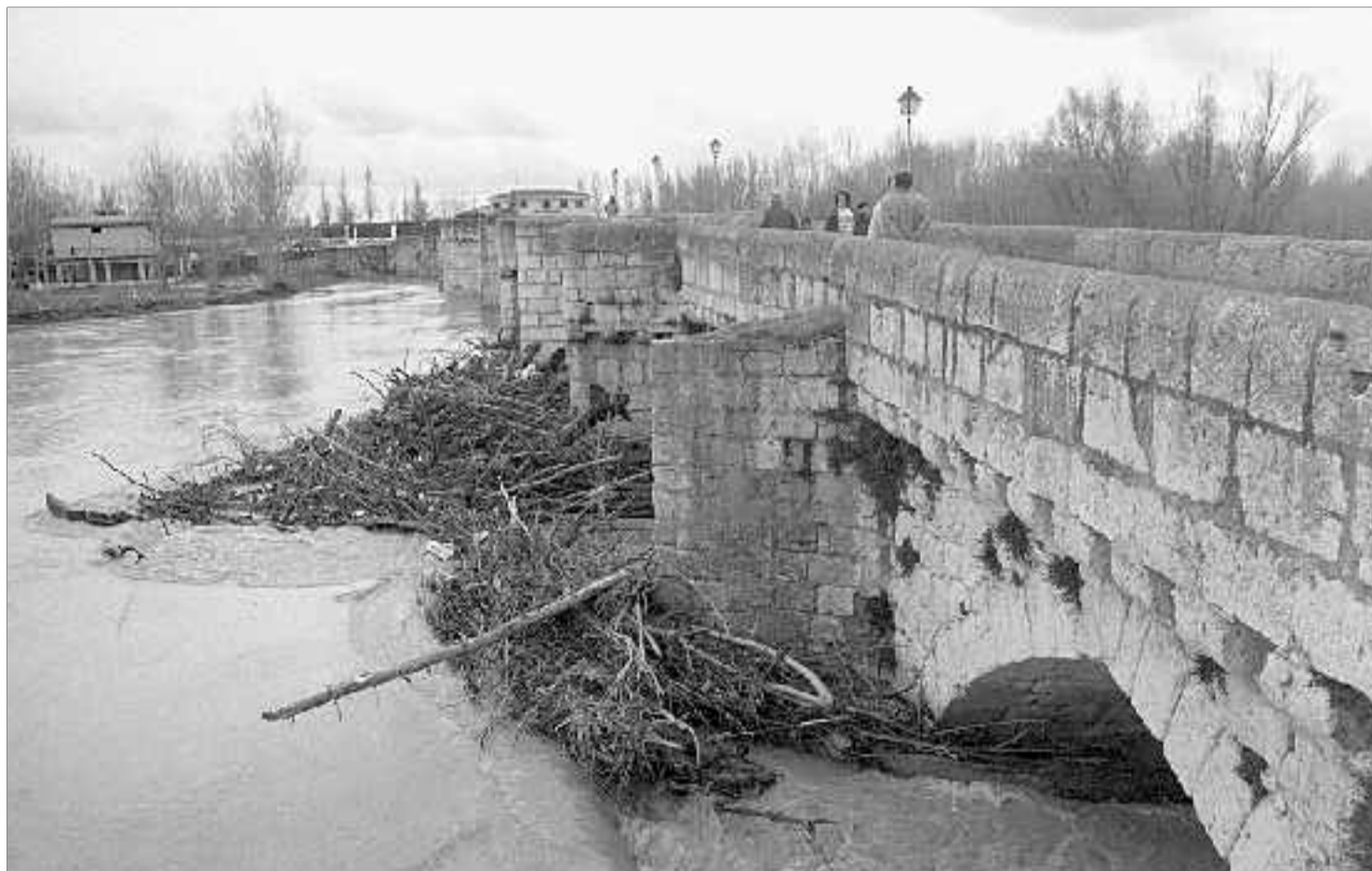
Los troncos atoraban ayer los ojos del puente romano de Simancas, cerrado al tráfico.