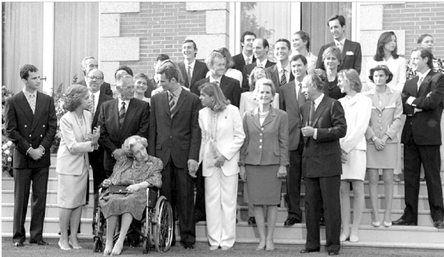
La Familia Real española y la familia Urdangarín, juntas en las escalinatas de La Zarzuela, al término de la ceremonia de petición de mano de la Infanta Cristina.