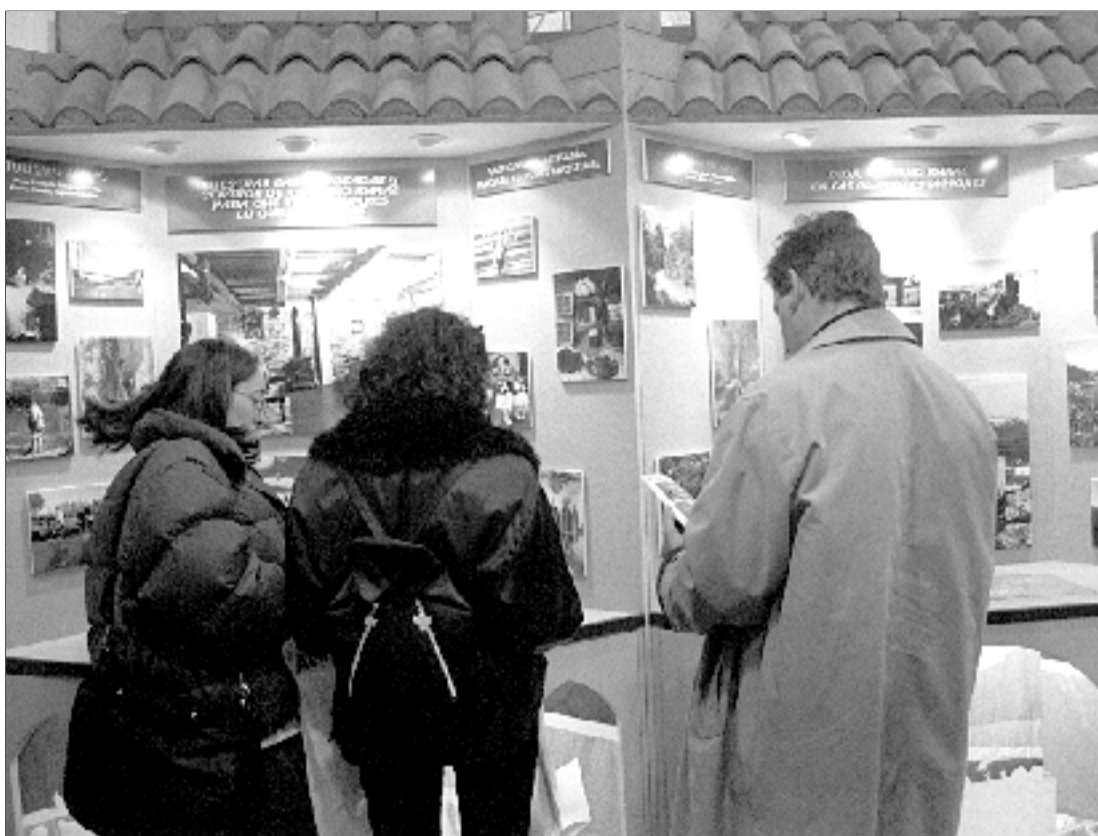
Tres personas consultan folletos turísticos en uno de los expositores de Intur.