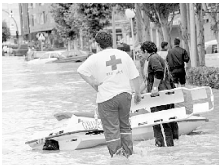
Una moto acuática se dispone a llevar una camilla.

Mientras, los Bomberos, la Policía Local y Protección Civil siguen trabajando con todos sus efectivos. La Subdelegación del Gobierno en Palencia constituyó ayer una comisión —integrada por representantes de la