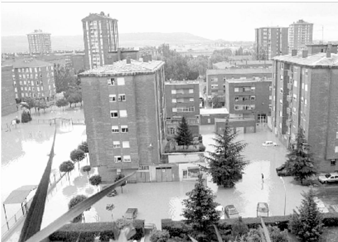
El barrio palentino de Pan y Guindas era ayer un inmenso lago.

La luz del día permitió contemplar las dimensiones reales de la tragedia. El arroyo de Villalobón que discurre por las proximidades del Polígono se había desbordado y las aguas