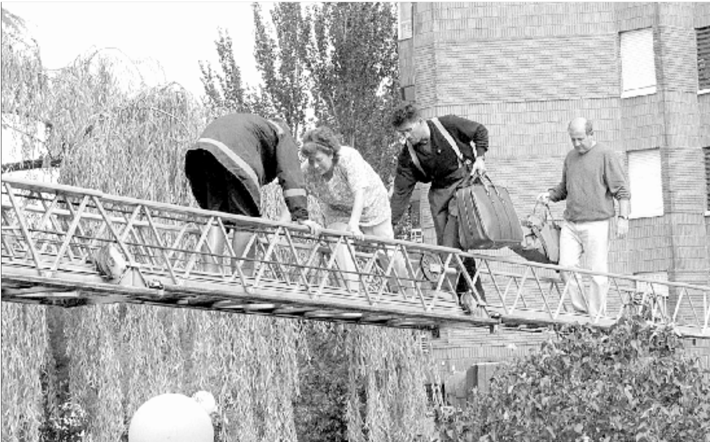
Los bomberos ayudan a un grupo de vecinos de Pan y Guindas a salir de sus casas.