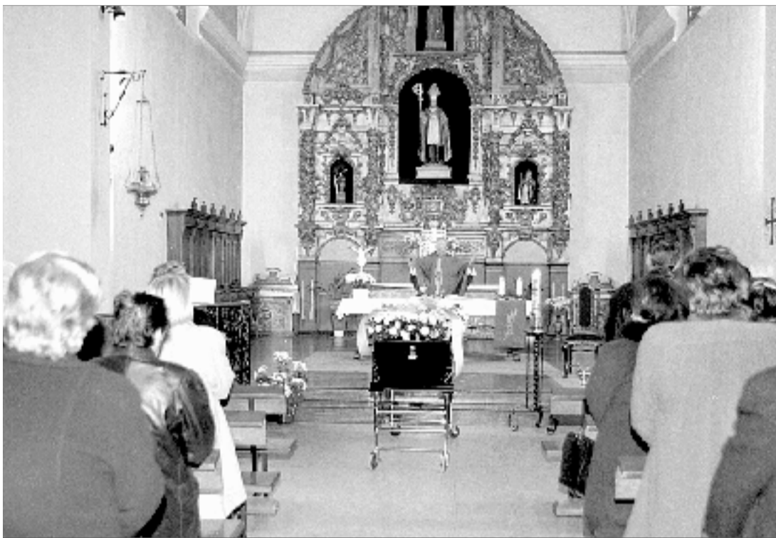
Numerosas personas asistieron al entierro de la anciana fallecida el miércoles.

El desplome de parte de la techumbre como consecuencia de la lluvia y la constatación llevada a cabo por los bomberos sobre el mal estado del inmueble motivó su desalojo preventivo. Indicó el responsable de la Concejalia que, por el momento, este es el único que podría ser considerado en peligro de ruina